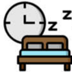
Δυσκολίες στον ύπνο

Ειδικότερα, όσον αφορά τα παιδιά, όσο μικρότερα σε ηλικία είναι, τόσο τείνουν να αναπτύσσουν ψυχοσωματικά συμπτώματα και δυσκολίες στον ύπνο σε περιόδους αυξημένου άγχους.