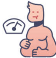
Αλλαγές στις διατροφικές συνήθειες